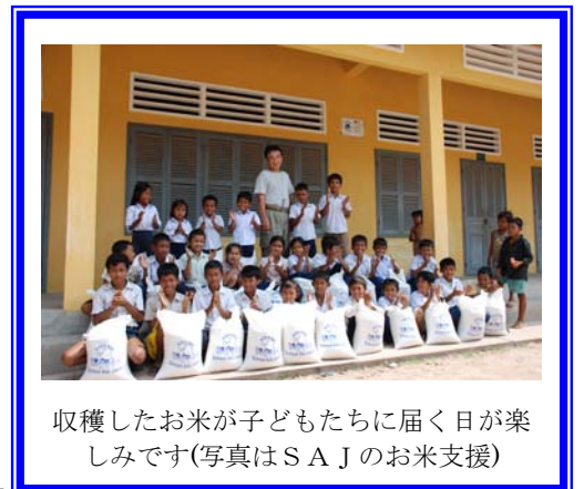
収穫したお米が子どもたちに届く日が楽しみです(写真はS A Jのお米支援)

機械を使った効率が良い農業を考えています。「食べて安全で安心な有機農業」を行う予定です。農業専門学校や農業大学を出た孤児院の子どもたちの雇用だけでなく、広く地元の人を雇い、技術を教え広めて、地方の州の雇用の創出とカンボジアの農業技術の向上に貢献したい「夢」を描いています。