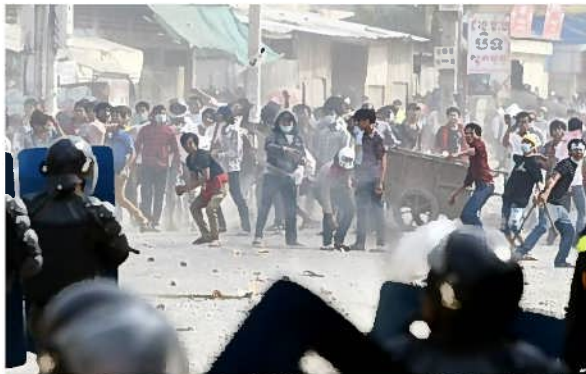
最低賃金値上げを訴えるデモ 警官隊に石を投げています

また、物価の上昇も著しく、校舎建設費も上がりました。SAJでは入札により建設価格を決めています。どこの建設会社も値上がりしています。今では5教室建設で輸送費も合わせて6万5千ドルになります。現在は学校建設の数を減らす方法で検討しています。