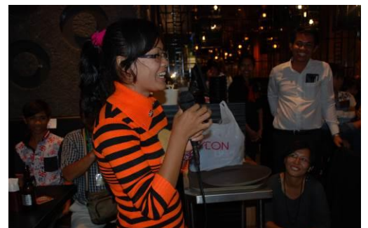
流暢な日本語で日本からの支援者様に向けてスピーチをするソペアック