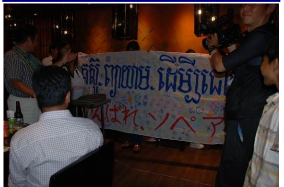
孤児院の皆が応援の横断幕をつくってくれました