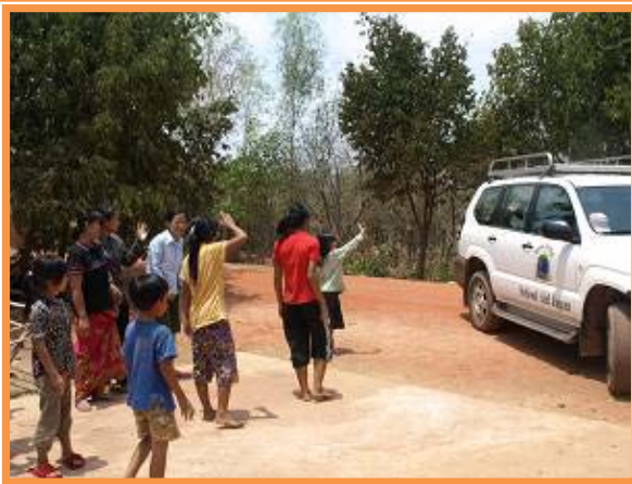
先に出発する子どもをみんなで見送り