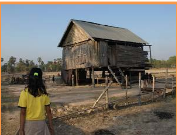
育ててくれた家に到着です

5月も半ばを過ぎ、カンボジアでは時々スコールが降るようになりました。雨季の始まりを徐々に感じる今日この頃です。