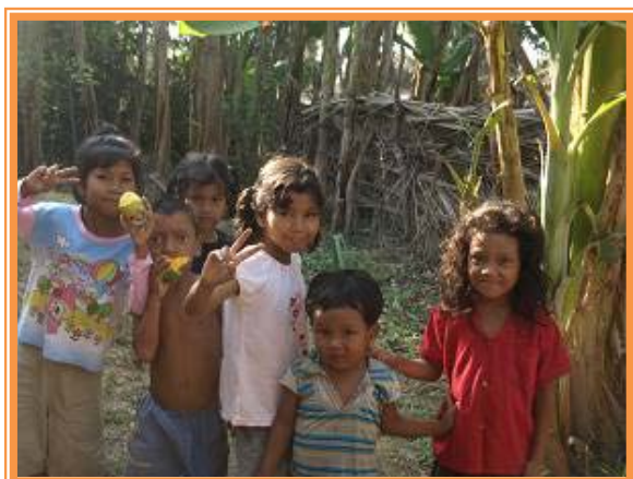
地元の友達とも再開

帰省が終わると、みんな元気に園にもどってきました。一人の怪我もなく……というわけにはいかず、一人腕を怪我してしまった子がいましたが、その子も笑顔で園にもどってきました。