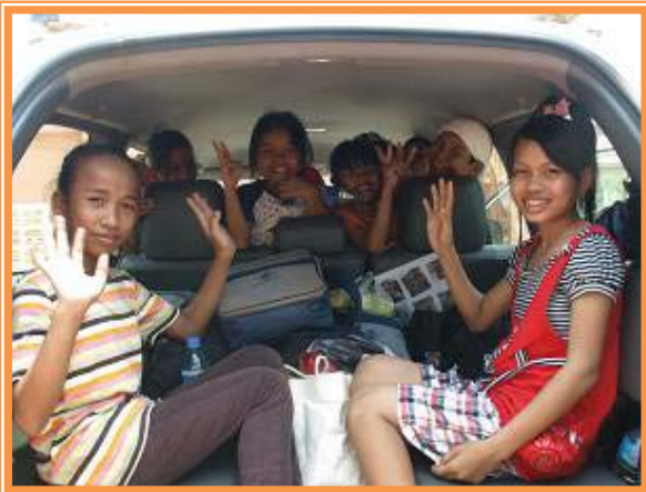
久しぶりの帰省にみんな笑顔です