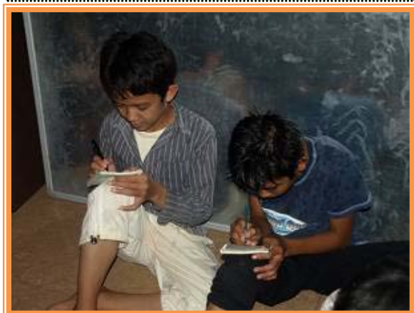
一所懸命メモを取っています

子どもたちが、将来自分の夢をつかむことができるよう、職員一丸となって頑張っています。