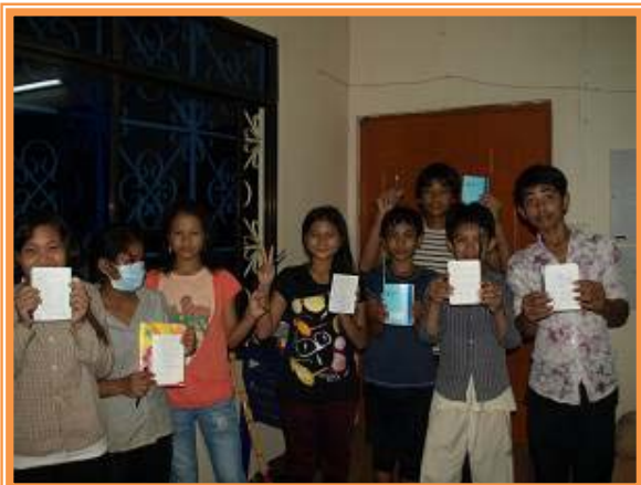
園の自慢のルームリーダーたち